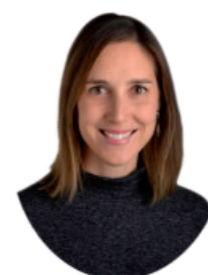
7. ELENA ROMÁN ANDRÉS CONSERVATORIO DE MÚSICA (BURGOS)