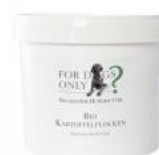
COPOS DE PATATA